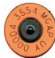
Caravana con Chip

par debe poseer un dispositivo de radiofrecuencia (RFID), pudiendo optarse por caravana con chip o bolo con chip para colocar por boca en el retículo. No se admitirán identificadores inyectables. Tal fue lo que indicó el pliego de la licitación.